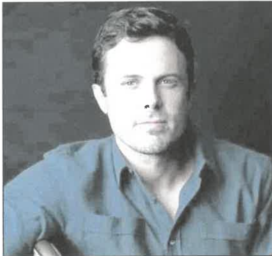
L'OSPITE Casey Affleck con il film Light of my Life

È il pezzo forte delle anticipazioni del festival guidato da Fabia Bettini e Gianluca Giannelli, già da tempo maturo e forte di una sua solida identità editoriale, ma ora determinato a "rico-