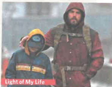
Light of My Life