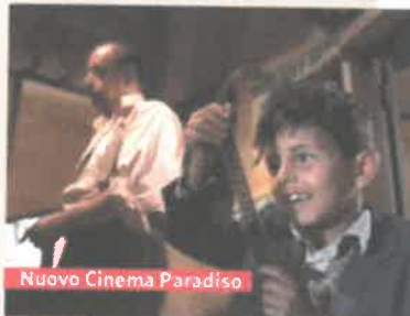
Nuovo Cinema Paradiso