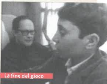
La fine del gioco